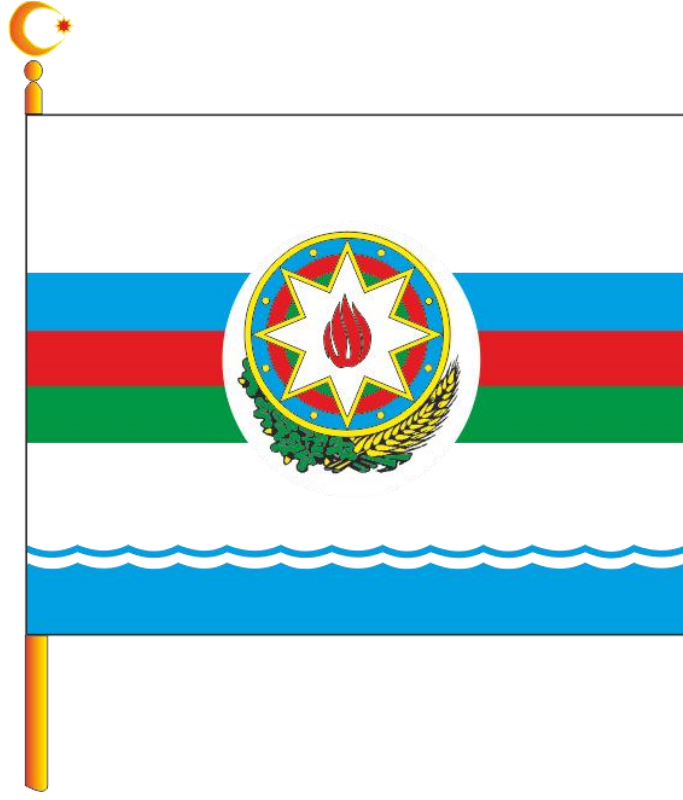
Şək. 4. Azərbaycan Respublikasının Silahlı Qüvvələri Ali Baş Komandanının Bayrağı