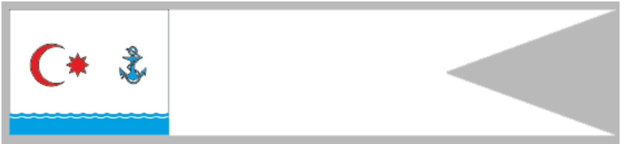
Şək. 11. Reyd böyünün breyd-vımpeli