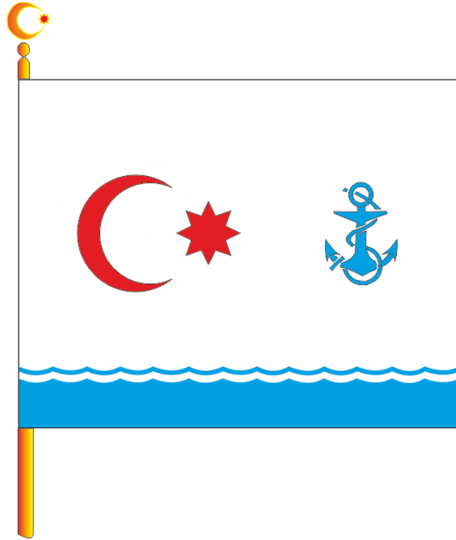
Şək. 1. Azərbaycan Respublikasının Hərbi-Dəniz Bayrağı

Breyd-vımpelin uzunluğunun bayrağın eninə nisbəti 5:1-dir. Şüaların kəsiyinin uzunluğu bayrağın uzunluğuna bərabərdir. Şüaların yayılması bayrağın eninin 1/2-nə bərabərdir.