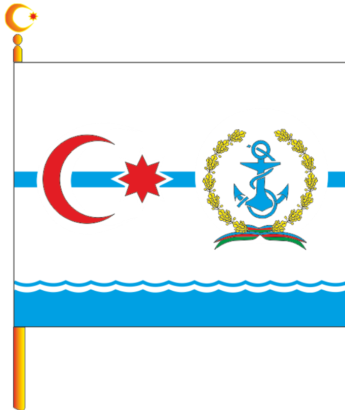
Şək. 7. Azərbaycan Respublikası Hərbi-Dəniz Qüvvələri qərargahı rəisinin Bayrağı