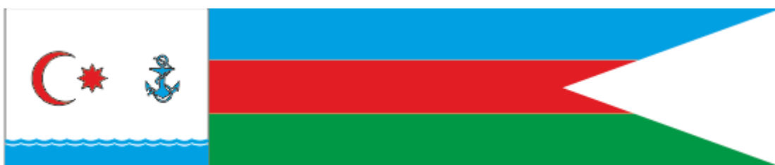
Şək. 9. Gəmilər birləşməsi komandirinin breyd-vımpeli