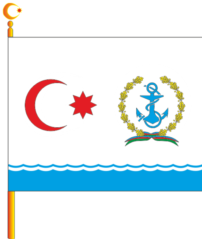
Şək. 8. Gəmilər birləşməsi komandirinin Bayrağı