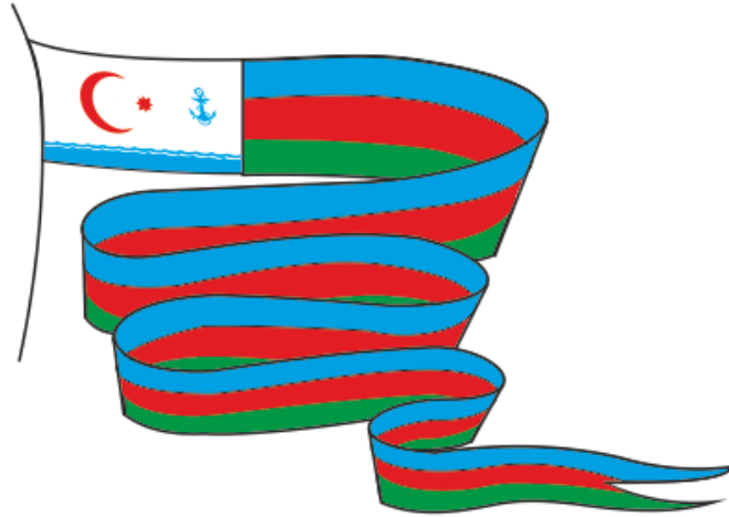
Şək. 3. Hərbi gəmilərin vımpeli