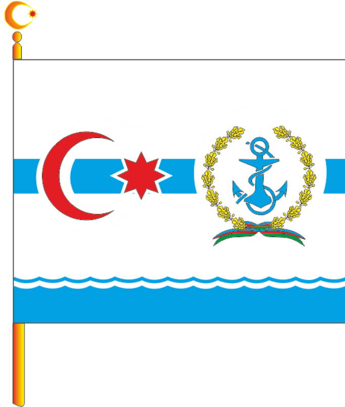
Şək. 5. Azərbaycan Respublikası müdafiə nazirinin Bayrağı