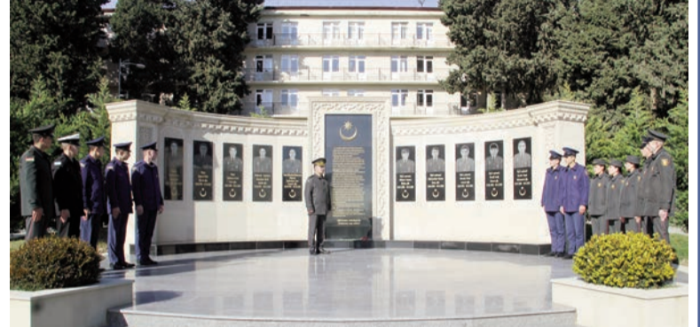
"Şəhidlərimizin və hərbiçilərimizin keçdiyi şərəfli döyüş yolu hər birimiz üçün nümunədir"

"Biz bu gün burada təhsil alan kursantlara dünənki qəhrəmanlarımızın sabahki davamçıları kimi baxırıq. Ona görə də təcrübəli, eyni zamanda, bilikli zabit və professor-müəllim heyəti tərəfindən kursantlara hərbi biliklər aşılanır. Tədris