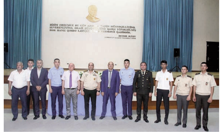
Sonda AMEA MEK-nin nümayəndələri tərəfindən institutun kitabxanasına 30 ədəd kitab hədiyyə edildi.