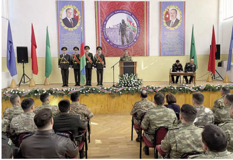
(Əvvəli 3-cü səhifədə)

Müdafiə naziri təbrik məktubunda əmin olduğunu bildi-rib ki, Azərbaycan Ordusunun şəxsi heyəti, xüsusilə ordu gəncləri göstərilən ali etimadı bundan sonra da doğrulda-raq, torpaqlarımızın keşiyin-də mərdliklə duracaq, xalqı-mızı gələcəkdə də döyüş, mənəvi-psixoloji hazırlıqda əl-də etdiyi uğurlar və nailiyyətl-er ilə mütəmadi olaraq sevin-dirəcəklər.