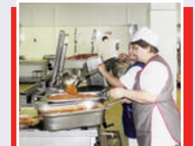
Əsgərlər üçün keyfiyyətli yeməklər hazırlanır