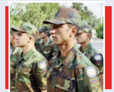
Bir qrup sülhməramlı əsgər Əfqanıstana göndərilib