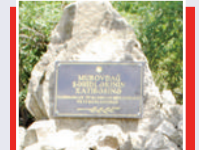
Murovdağ döyüşçülərinin şəərəinə ucaldılmış xatirə abidəsinin açılışı olmuşdur