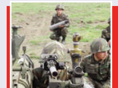
Topçular təlimdə bacarıqlarını nümayiş etdirdilər