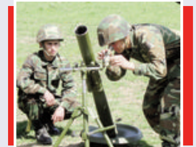
Hazırlıq yüksək olanda...