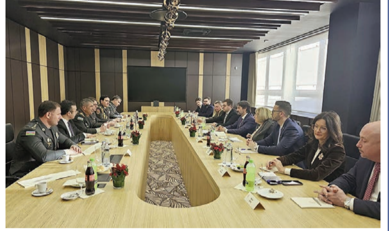
əməkdaşlığın cari vəziyyəti barədə ətraflı fikir mübadiləsi aparılıb, qarşılıqlı səfərlərin əhəmiyyəti vurğulanıb.

Görüşdə Azərbaycan ilə Slovakiya arasında hərbi