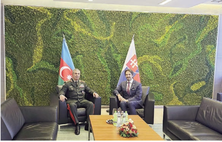
Azərbaycan Respublikasının müdafiə naziri general-polkovnik Zakir Həsənov Slovakiya Respublikasının Baş nazirinin müavini və müdafiə naziri cənab Robert Kalinakinin dəvəti