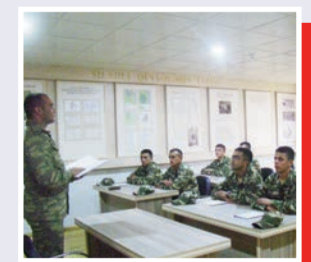
Mənəvi-psixoloji hazırlıq yüksək səviyyədə təşkil edilir