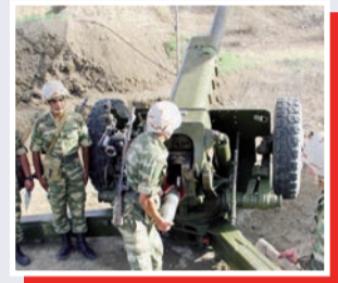
“Tapşırıqları yerinə yetirəcəyik”