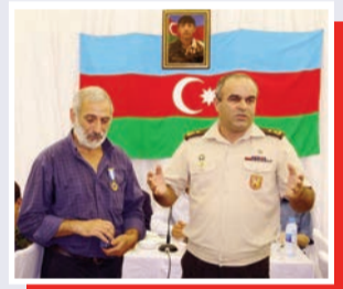
Şəhidin medalı ailəsinə təqdim olunub