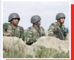
“Vətən, sənin əsgərinəm!..”