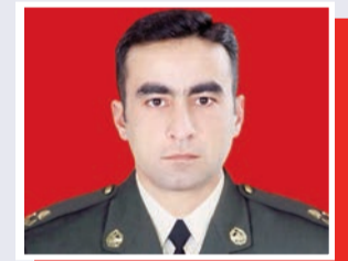
İgidi şücaəti yaşadır