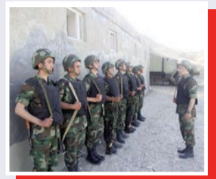
Haqq zəfərimizin ünvanı - Lələtəpə