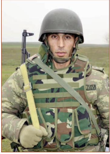
(Əvvəlki 4-cü səhifədə)