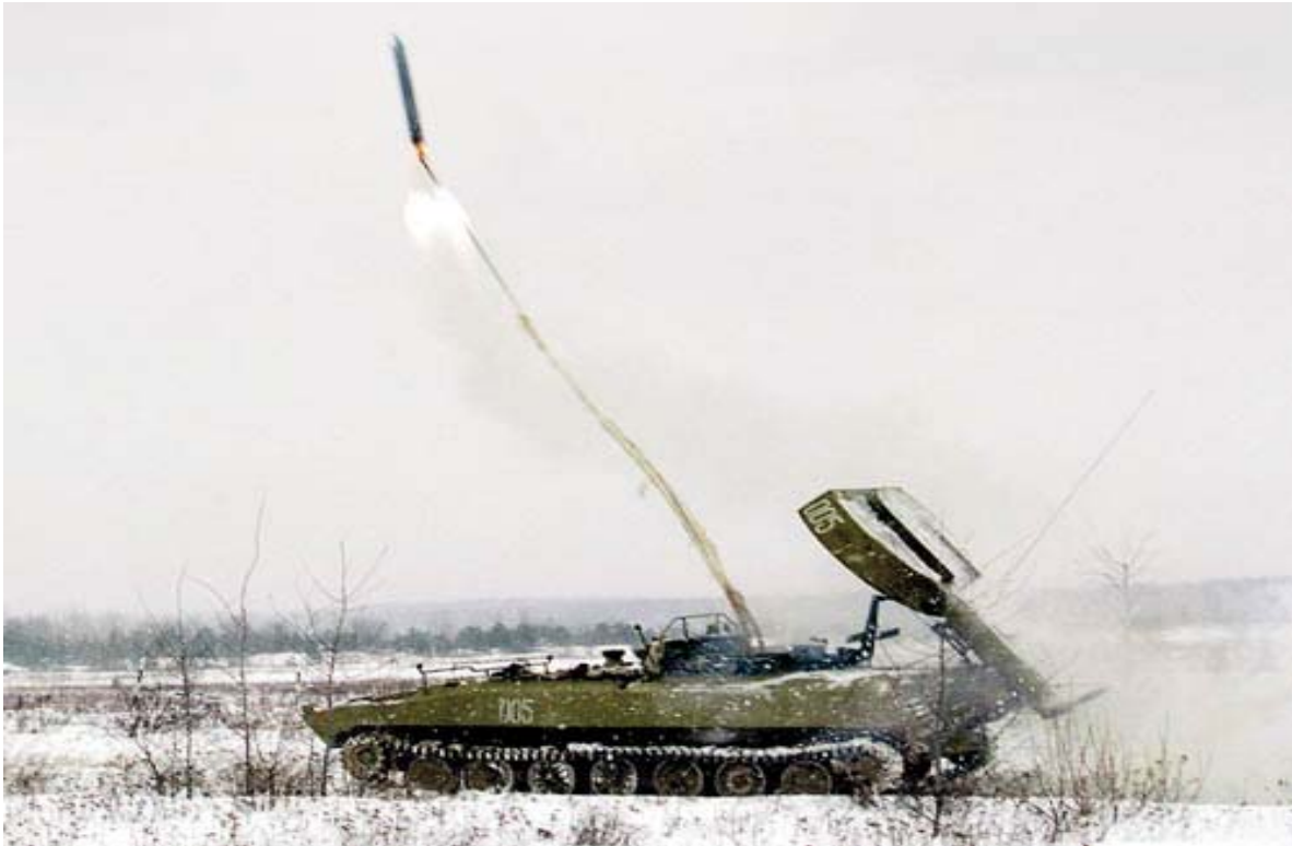
Şəkil 2. UR-77 (Meteorit) – maneələrdən keçidaçma maşını (Rusiya)

İnkişaf etmiş bəzi ölkələrin müasir ordularının silahlanmasında olan partlayış üsulu ilə keçidaçma vasitələri və onların xüsusiyyətləri: