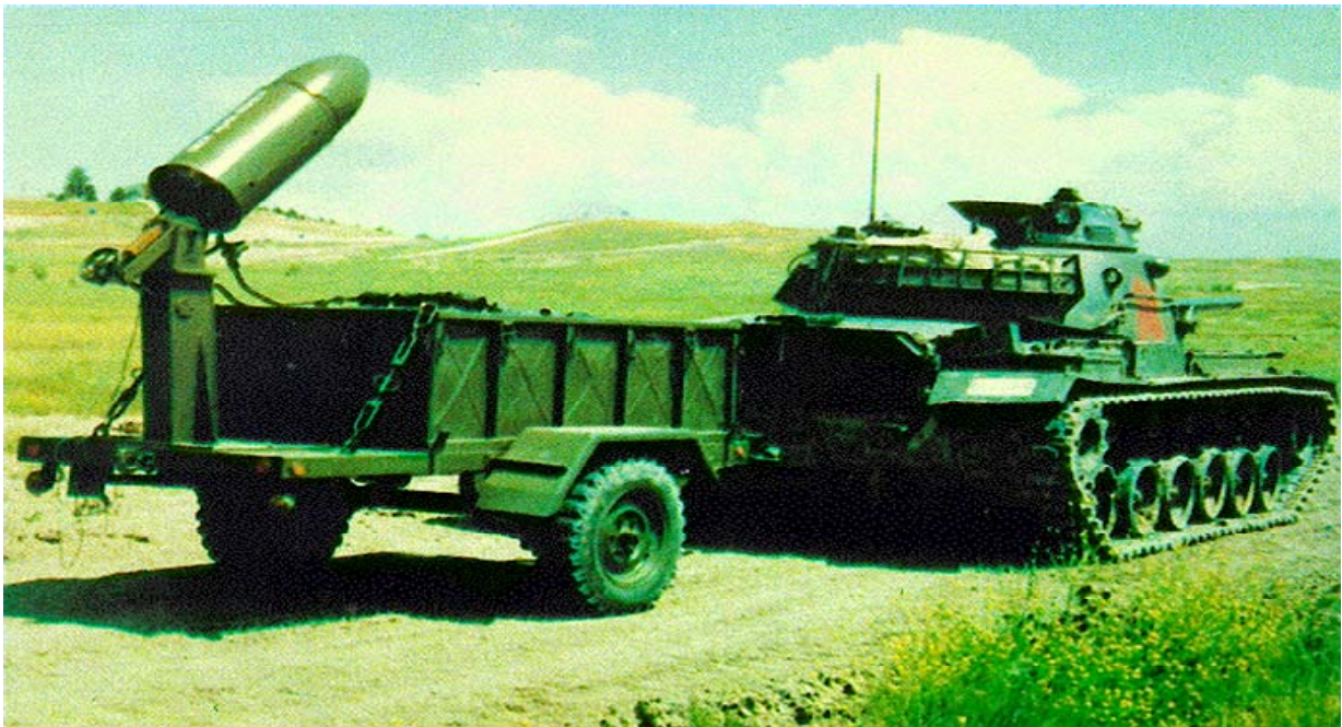
Şəkil 5. TAMKAR – maneələrdən keçidaçma sistemi (Türkiyə) [6]

c) Türkiyədə MKE şirkəti tərəfindən istehsal olunan TAMKAR (Şəkil 5) vasitələri Türkiyə silahlı qüvvələrində tətbiq edilir. Bu RSAXA minalı sahədən partlatma yolu ilə 100 m uzunluğunda, 10 m genişliyində keçid açmaq qabiliyyətinə malikdir. Əlavə atımla keçidin dərinliyini 200 m-dək uzatmaq mümkündür. Mina sahəsinə 80 m məsafədən atılır. Partlayıcı maddənin çəkisi (C4 tipli) 400, sistemin ümumi çəkisi 2530 kq-dır [3];