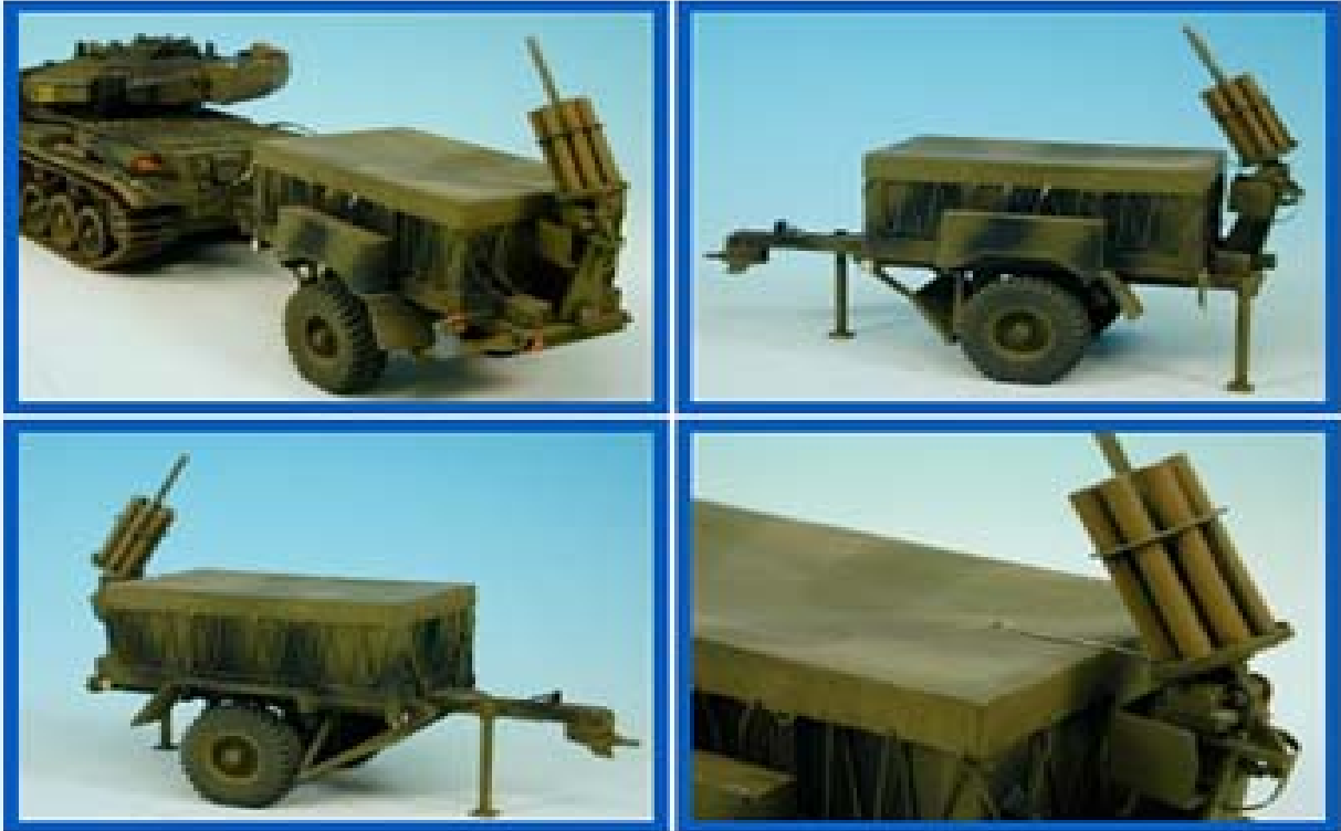
Şəkil 4. GIANT VIPER – maneələrdən keçidaçan qurğu (İngiltərə)

c) Türkiyədə MKE şirkəti tərəfindən istehsal olunan TAMKAR (Şəkil 5) vasitələri Türkiyə silahlı qüvvələrində tətbiq edilir. Bu RSAXA minalı sahədən partlatma yolu ilə 100 m uzunluğunda, 10 m genişliyində keçid açmaq qabiliyyətinə malikdir. Əlavə atımla keçidin dərinliyini 200 m-dək uzatmaq mümkündür. Mina sahəsinə 80 m məsafədən atılır. Partlayıcı maddənin çəkisi (C4 tipli) 400, sistemin ümumi çəkisi 2530 kq-dır [3];