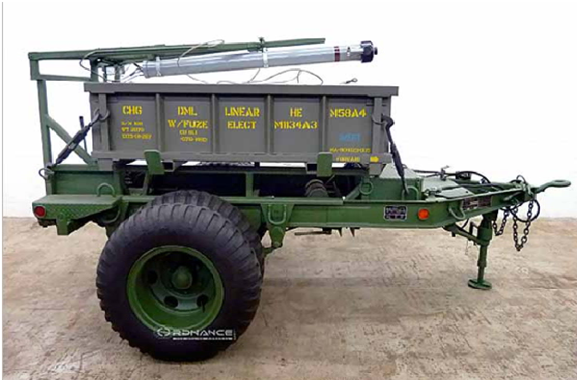
Şəkil 3. M58 MICLIC – maneələrdən keçid açan qurğu (ABŞ) [6]

b) İngiltərədə istehsal olunan GIANT VIPER (Şəkil 4) vasitəsilə 183–200 m uzunluğunda, 7,3 m genişliyində keçid açılır. Mina sahəsinə 115–140 m məsafədən atılır, sistemin ümumi ağırlığı 2136 kq-dır [5];