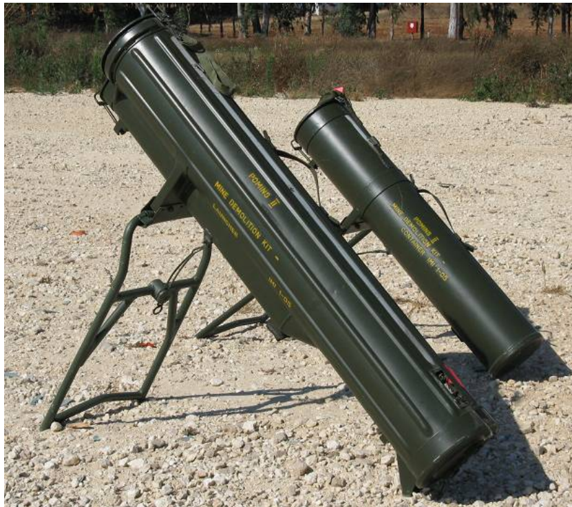
Şəkil 6. POMİNS II qurğusunun ümumi görünüşü (İsrail)

İsraildə istehsal olunan, piyada əleyhinə maneələrdən partlayış üsulu ilə keçidaçma vasitəsi dövrümüzün ən müasir sistemi hesab olunan POMİNS-II (Şəkil 6) dövlətimiz tərəfindən alınaraq ordumuzun silahlanmasına daxil edilmişdir [2, s.188].