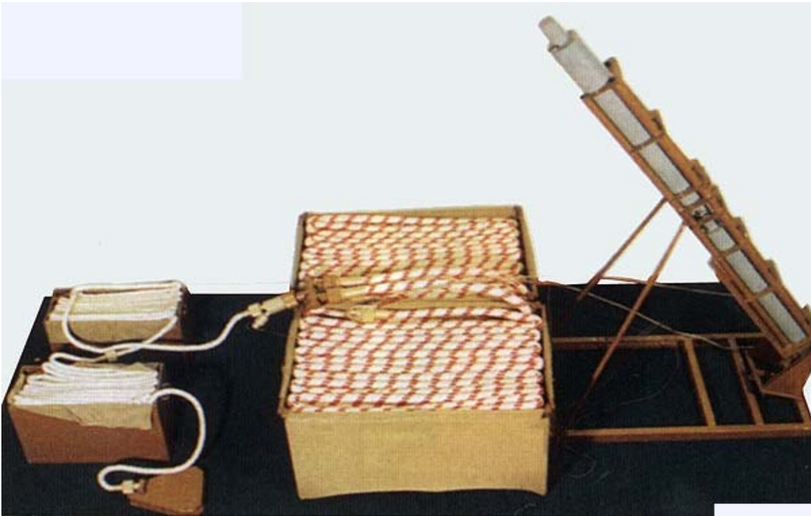
Şəkil 1. UR-83P – daşınan keçidaçma qurğusu (Rusiya)

Rusiyada istehsal olunan özüyəriyən keçidaçma qurğusu UR-77 (Şəkil 2). Baza maşını yüngül zirehli çoxtəyinatlı dartıcı olan bu qurğunun heyəti 2 nəfərdən ibarətdir. Maşının ümumi kütləsi 14,1 tondur. Maksimal sürəti 60 km/saatdır. Döyüş dəsti 2 UZP-67 və ya 2 UZP-77-dən ibarətdir. Atım buraxıldıqdan 3–5 dəqiqə sonra avtomatik olaraq partlayır. Atım partlayışının nəticəsində mina sahəsindən UZP-67 atımı ilə 75–80 m, UZP-77 atımı ilə 80–90 m uzunluğunda, 6 m enində keçid açılır. İki atımın yenidən doldurulma vaxtı 30–40 dəqiqə ərzində yerinə yetirilir [2, s.176].