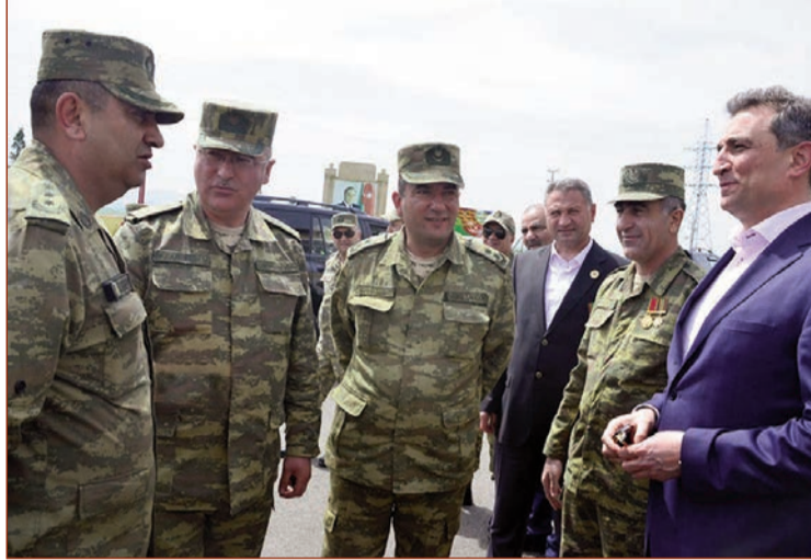
Azərbaycan Qarabağ Müharibəsi Əlilləri, Veteranları və Şəhid Ailələri İctimai Birliyinin Qaradağ rayon filialının fəal üzvləri, ARDNŞ-a məxsus BOS Şəfə MMC-nin əməkdaşları,

eləcə də müəssisədə çalışan bir qrup müharibə əlillərindən ibarət nümayəndə heyəti cəbhə bölgəsində yerləşən hərbi hissədə əsgərlərlə görüşüb.