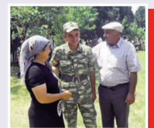
“Hərbi hissədə hər cür şərait yaradılıb”