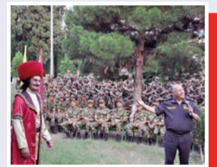
“Ulu şahım, qılıncına söykənim!”