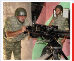
“Yenə hərbi xidmətdəyəm”