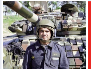
“Vətən üçün yaşayırıq”