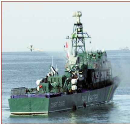
"Tufan" gözetçi gəmisi öz təchizatına görə ordunun müasir gəmisidir.

Gəminin uzunluğu 62 metr, subasımlı 470 tondur. "Tufan" gəmisdə 25 kilometrlik atış məsafəsinə malik olan "Spike-NLOS" raketlərindən istifadə edilir. Müxtəlif hava şəraitində gəminin göyertəsinə helikopterlərin enib-qalxması mümkündür. Bundan başqa gəmi bir ədəd 23 mm çaplı 2A14 topuyla silahlanmış "Typhoon", iki ədəd 12,7 mm çaplı M2HB pulemyotu, "Mini Typhoon" modulu, iki ədəd "Negev" pulemyotu ilə təchiz edilib. Gəmi uzaq məsafədən sualtı təhdidləri aşkarlamaq üçün müasir sonar sistemi ilə təchiz olunub.