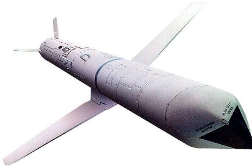
Şəkil 2. “AGM-84H SLAM-ER“ gəmi əleyhinə idarəolunan raketin ümumi görünüşü

“Hava-yer” sinfinə aid gəmi əleyhinə idarəolunan raketlərin inkişaf imkanlarından danışarkən hərbi mütəxəssislər üç əsas istiqaməti seçib ayırırlar: texniki təkmilləşdirmə, sistemli yanaşma və yeni taktiki üsulların işlənilməsi (Şəkil 2).