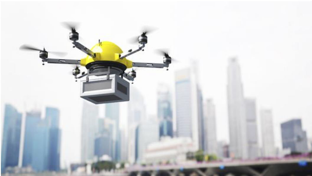
Şəkil 2. PUA ilə yüklərin daşınması

Hər şeydən əvvəl, xəritəçəkmə məqsədləri üçün aerofotoçəkilişlərin həyata keçirilməsi zamanı istifadə olunan PUA mükəmməl bir avtopilota malik olmalıdır. Bu avtopilot aparatın kütləsinin az olmasına baxmayaraq, çəkiliş parametrlərini (marşrut, kameranın əyilmə bucaqları, uzununa və eninə örtmə faizi, hündürlük və s.) saxlamağı bacarmalıdır [2].