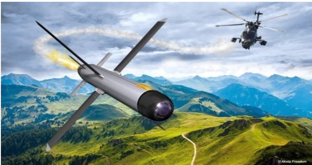
Şəkil 3. “Spike NLOS” tank əleyhinə idarəolunan raketin ümumi görünüşü

Azərbaycan Ordusu arsenalında da yüksək dəqiqliyə malik məhvetmə vasitələri, o cümlədən “hava-yer” sinifli idarəolunan raketlərin müxtəlif modifikasiyaları mövcuddur. Silahlı Qüvvələrimizin 44 gün davam etmiş Vətən müharibəsində xarici ölkələrin istehsalı olan bir çox müasir silah sistemlərini ilk dəfə döyüşdə tətbiq etməklə adını dünya hərbi tarixinə yazdı. Döyüş əməliyyatlarında idarəolunan raketlər və pilotsuz uçuş aparatlarından uğurla, o cümlədən koordinasiyalı şəkildə istifadə edildi. “Spike”, “Baryer” tipli tank əleyhinə idarəolunan raketlərin müxtəlif modifikasiyaları düşmənin zirehli tank texnikasına və möhkəmləndirilmiş müdafiə mövqelərinə qarşı uğurla tətbiq olundu (Şəkil 3). Bu raketlərin tətbiqi düşmənin cəbhənin dərinliyindəki strateji obyektlərinin, sursat anbarlarının və hərbi bazalarının yüksək dəqiqliklə məhv edilməsinə imkan verdi.