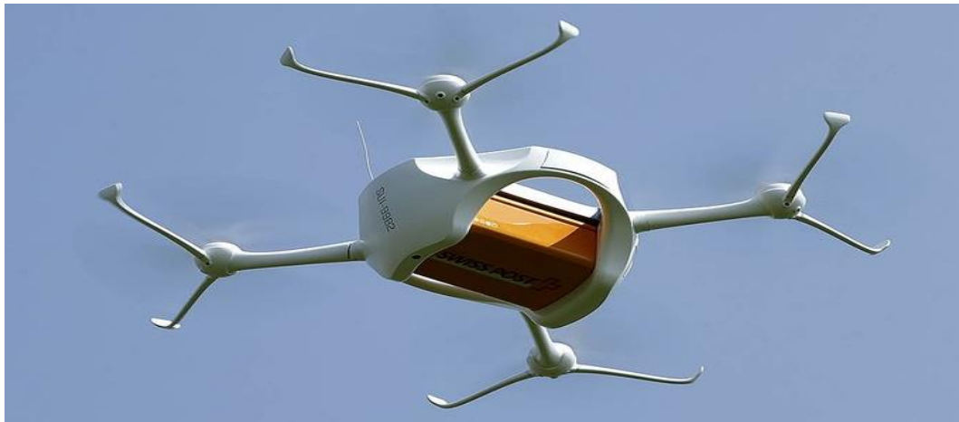
Şəkil 3. PUA ilə ərazinin fotoçəkilişi

Girotənzimləyici qurğu (giroplatforma) aerokameranı verilmiş vəziyyətdə saxlamaq, PUA-nın titrəmələrinin aeroçəkilişlərin keyfiyyətinə göstərdiyi təsiri azaltmaq, uçuş və eniş zamanı zərbələri zəiflətmək və s. üçündür.