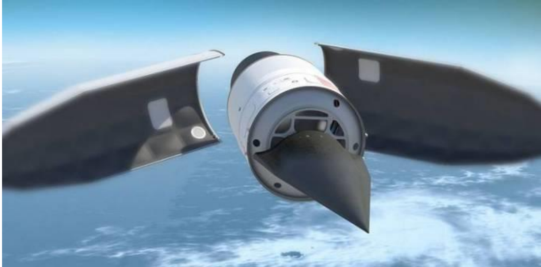
Şəkil 1. Qabaqcıl hipersəs silah döyüş başlığı üçün inkişaf etdirilən hipersəs silahının eksperimental konsepsiyası

Beləliklə, xarici ölkələrin Silahlı Qüvvələrində tank əleyhinə idarəolunan raketlərin inkişafı, əsasən eyni anda bir neçə hədəfi məhv edə bilən sistemlərin yaradılmasına, uçuş sürətinin, tətbiqəilmə məsafəsinin və hədəfin məhvetmə ehtimalının artırılmasına yönəldilib. Bu parametrlərin təkmilləşdirilməsi bir neçə idarəetmə və tuşlama sistemindən (Qlobal Naviqasiya Peyk Sistemi, İnersiyal Naviqasiya Sistemi, özütüşlanan başlıq), start və marş mühərriklərindən istifadə edilməsi, raket yanacağıının tərkibinin və kumulyativ tandemli döyüş hissəsinin yenilənməsi, yeni raket texnologiyalarının yaradılması hesabına həyata keçirilir [4].