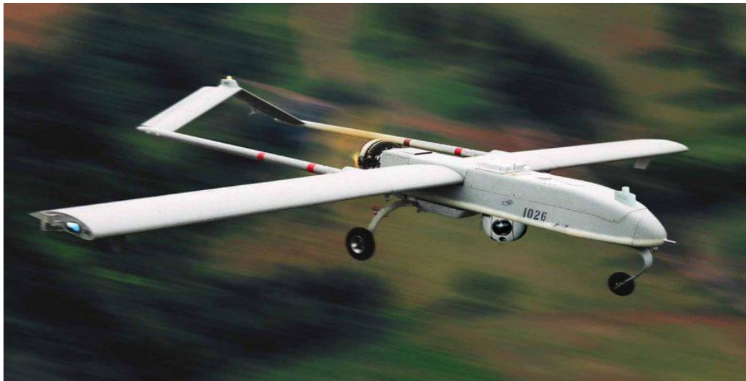
Şəkil 1. Pilotsuz uçuş aparatı

PUA-ların vahid hava məkanına inteqrasiya edilməsi üçün normativ-hüquqi bazanın olmaması aerofotoçəkiliş ehtiyacları üçün PUA bazarının inkişafını əngəlləyir. Bu səbəbdən də tənzimləyici normativ-hüquqi bazanın yaradılmasını gözləmədən xüsusi səlahiyyətlərə malik strukturlar tərəfindən