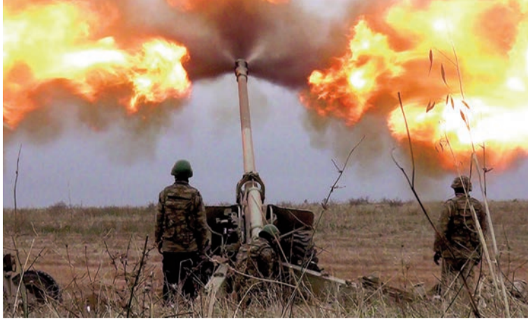
(Əvvəlki 1-ci səhifədə)

Ermənistan ordusunun təxribatı və bir hərbi qulluqçumuzun şəhid edilməsi ilə başlanan döyüş əməliyyatı, strateji cəhətdən bir çox əhəmiyyətli tapşırıqların icrası ilə nəticələndi. Əməliyyatın yerinə yetirilməsində qeyd ediləsi əsas məqamlar, əməliyyatda iştirak edən şəxsi heyətin bacarığı və əməliyyat planına uyğun olaraq qarşıya qoyulan tapşırıqların dəqiqliklə, təyin edilmiş vaxtda icra edilməsidir. Yüksək peşəkarlıqla hazırlanan, Müdafiə nazirliyinin rəhbərliyi ilə razılaşdırılan və Ali Baş Komandan tərəfindən təsdiq edildikdən sonra əməliyyatda iştirak edən bölmələrimiz hərəkətə başladı. Müzəffər Ali Baş komandan tərəfindən verilən ən əsas tapşırıq isə, əməliyyat zamanı şəxsi heyətin maksimal dərəcədə qorunması və ən az itki verməklə qarşıya qoyulan tapşırıqların icra edilməsi idi.