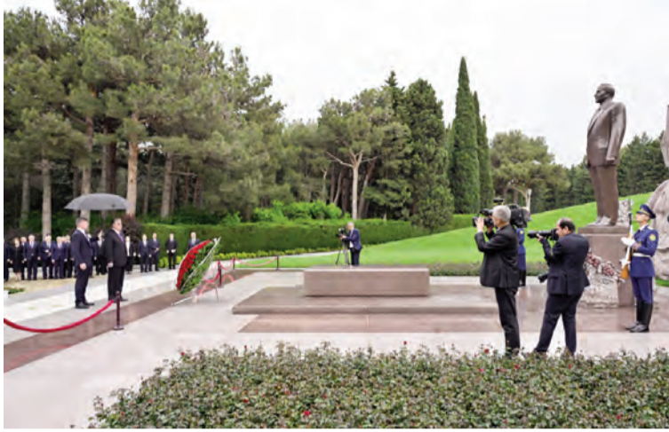
(Əvvəli 1-ci səhifədə)