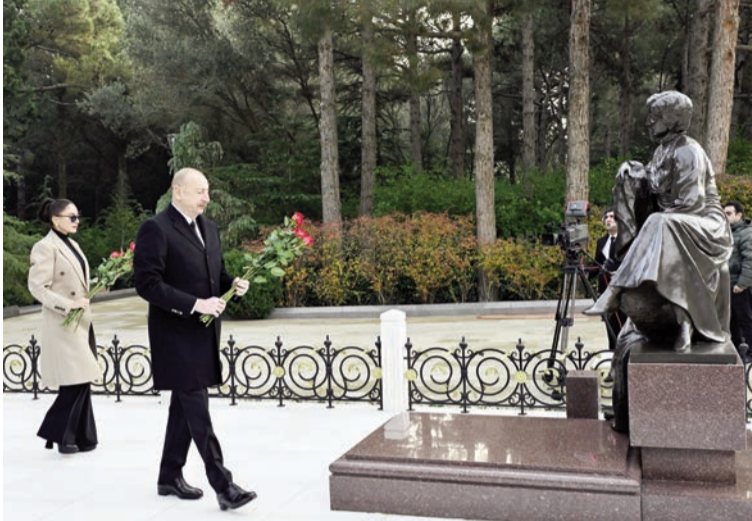
(Əvvəli 1-ci səhifədə)

Ümummilli Lider Heydər Əliyevin ən böyük arzusu Qarabağın düşmən tapdağından azad edilməsi, Azərbaycanı