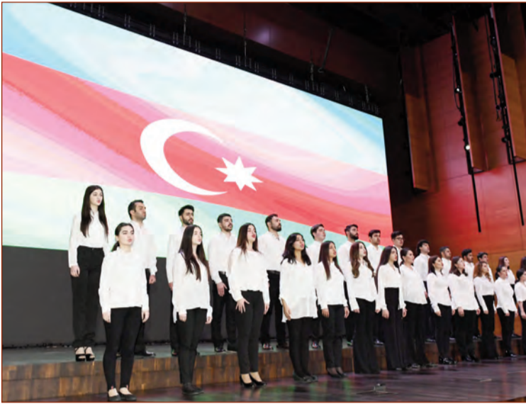
(Əvvəli 2-ci səhifədə)

Sosial problemlərin həlli daim diqqət mərkəzində olmalıdır. Bu sahəyə çox böyük diqqət göstərilir, çox böyük vəsait ayrılır. Xüsusilə məcburi köçkünlərin, şəhid ailələrinin, Qarabağ müharibəsi əlillərinin sosial problemlərinin həlli üçün böyük vəsait ayrılır. Onlar üçün şəhərciklər salınır, minlərlə ev tikilib və tikiləcəkdir. Ünvanlı sosial yardım alanların da problemləri daim diqqət mərkəzindədir. Onlar hələ də öz imkanlarını özləri təmin edə bilmirlər. Ona görə təbiidir ki, Azərbaycan dövləti onlara dəstək göstərir. Onu da bildirməliyəm ki, Azərbaycan ünvanlı sosial yardım göstərən nadir ölkələrdəndir və bu, tam ədalətlidir. Biz çalışmalıyıq ki, hələ də öz maddi imkanlarını lazımi səviyyəyə qaldıra bilməyən vətəndaşlar dövlətdən dəstək alsınlar. Eyni zamanda, bundan sonrakı dövrdə özünüməşğulluq proqramı da geniş vüsət alacaq və dövlət hələ də yaxşı vəziyyətdə yaşamayan vətəndaşları müxtəlif vasitələrlə, aktivlərlə təmin edəcəkdir.