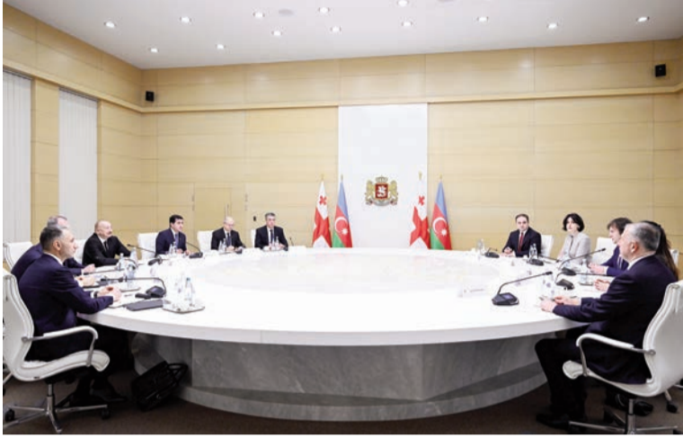
(Əvvəli 2-ci səhifədə)

Təbii ki, biz hər dəfə görüşəndə bir çox məsələləri müzakirə edirik, o cümlədən regional vəziyyət, regional təhlükəsizlik məsələlərini. Bu gün də istisna deyil. Bu gün Cənubi Qafqazda tamamilə yeni vəziyyət yaranmaqdadır və Cənubi Qafqazda yerləşən ölkələr bu imkanları əldən verməməlidir. Çünki bu gün sülh, təhlükəsizlik, əmin-amanlıq, sabitlik əfsuslar olsun ki, dünyanın müxtəlif yerlərində pozulur və bunun nəticəsində qanlı toqquşmalar, müharibələr, əzab-əziyyət və itkilər baş verir. Cənubi Qafqazda da vaxtilə buna oxşar mənzərə mövcud idi. Amma bu gün Cənubi Qafqaz artıq sülh, əmin-amanlıq, təhlükəsizlik, əməkdaşlıq məkanına çevrilir və mən burada Gürcüstanın rolunu da xüsusilə qeyd etmək istədim.