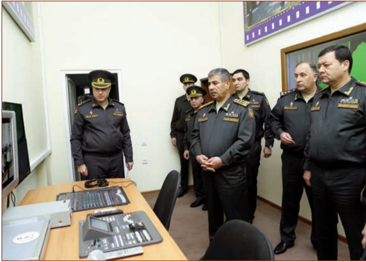
Müdafiə naziri general-polkovnik Zakir Həsənov və nazirliyin digər rəhbər heyəti Hərbi nəşriyyat, Sənədli və Tədris

Filmləri Kinostudiyası, eləcə də "Azərbaycan Ordusu" qəzeti redaksiyasında olub.