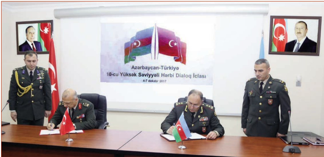
Türkiyə Respublikası Baş Qərargahı arasında Azərbaycan-Türkiyə Yüksək Səviyyəli Hərbi Dialoq İclasının yekunlarına dair protokol imzalanıb.

Sonda Azərbaycan Respublikası Müdafiə Nazirliyi ilə