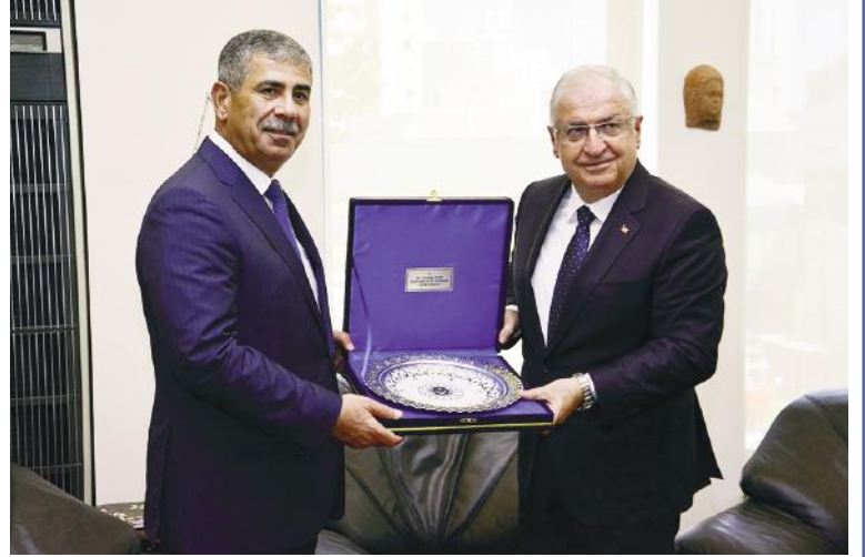
vəziyyəti və gələcəkdə bu istiqamətdə görülən işlərin daha da inkişaf etdirilməsi barədə müzakirələr aparılıb. Sonda qarşılıqlı hədiyyələr təqdim edilib.

Müdafiə Nazirliyi Mətbuat Xidməti xəbər verir ki, görüşdə hərbi, hərbi-texniki, hərbi təhsil, hərbi tibb və digər sahələrdə əməkdaşlığın cari