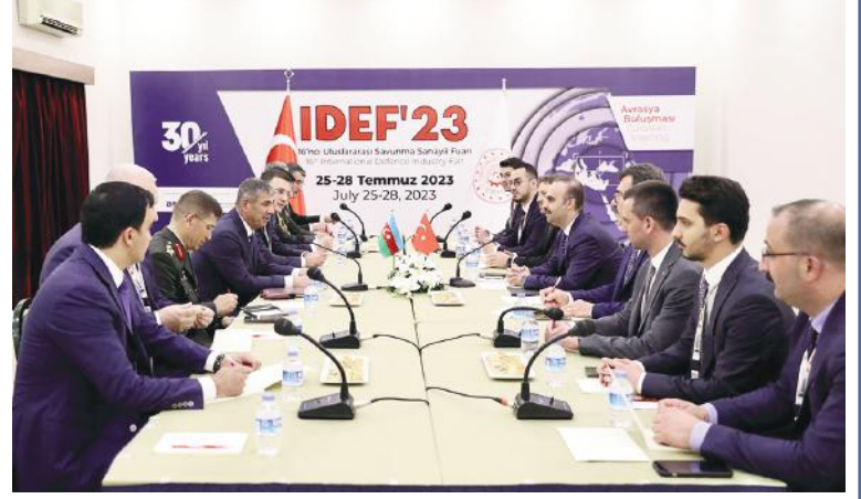
pektivləri müzakirə olunub, eləcə də qarşılıqlı maraq doğuran digər məsələlər barədə ətraflı fikir mübadiləsi aparılıb və qarşılıqlı hədiyyələr təqdim edilib.

Görüşdə hərbi-texniki əməkdaşlığın inkişaf pers-