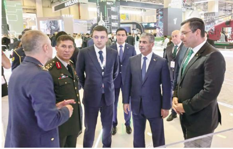
İyulun 25-də Azərbaycan Respublikasının müdafiə naziri general-polkovnik Zakir Həsənov və nazirliyin digər

rəhbər heyəti İstanbul şəhərində keçirilən "IDEF-23" 16-cı Beynəlxalq Müdafiə Sənayesi Sərgisinin açılış mərasimində iştirak edib.