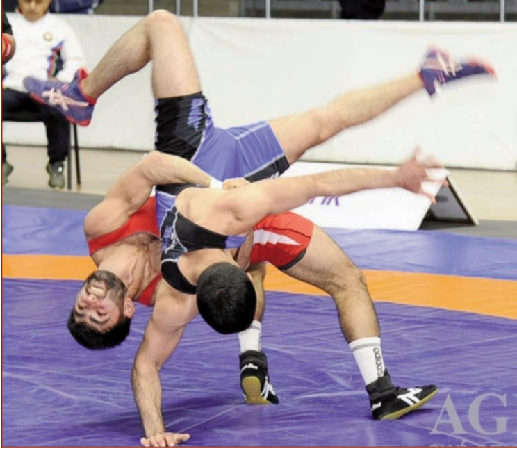
Bakı İdman Sarayında sərbəst və yunan-Roma güləşi üzrə böyükler arasında Azərbaycan çempionatı dekabrın 16-da da davam edib.

Yarışların əvvəlki günlərində 55, 60, 63, 67, 72, 77, 82, 87, 97 və 130 kiloqramadək çəki dərəcələrində yunan-Roma güləşçiləri qüvvələrini sınaqlayıblar. Ümumilikdə 177 yunan-Roma güləşçisinin mübarizə apardığı çempionat gərgin və maraqlı görüşlərlə yadda qalıb.