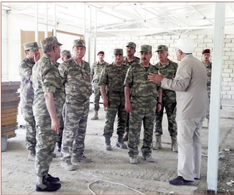
Azərbaycan Respublikasının Prezidenti, Silahlı Qüvvələrin Ali Baş Komandanı cənab İlham Əliyevin göstərişinə əsasən, yeni hərbi hissələrdə tikinti-inşaat işləri davam edir.

Müdafiə Nazirliyi Mətbuat Xidmətinin məlumatına əsasən, cəbhəboyu zonada olan Müdafiə naziri general-polkovnik Zakir Həsənov tikilməkdə olan hərbi şəhərciklərə baş çəkərək inşaat işlərinin keyfiyyəti ilə maraqlanıb. Müdafiə naziri inşa edilən qərargahlar, yataqxanalar, döyüş texnikası üçün saxlancılar, sıra meydanları, yeməxanalar, tibb məntəqələri, di-