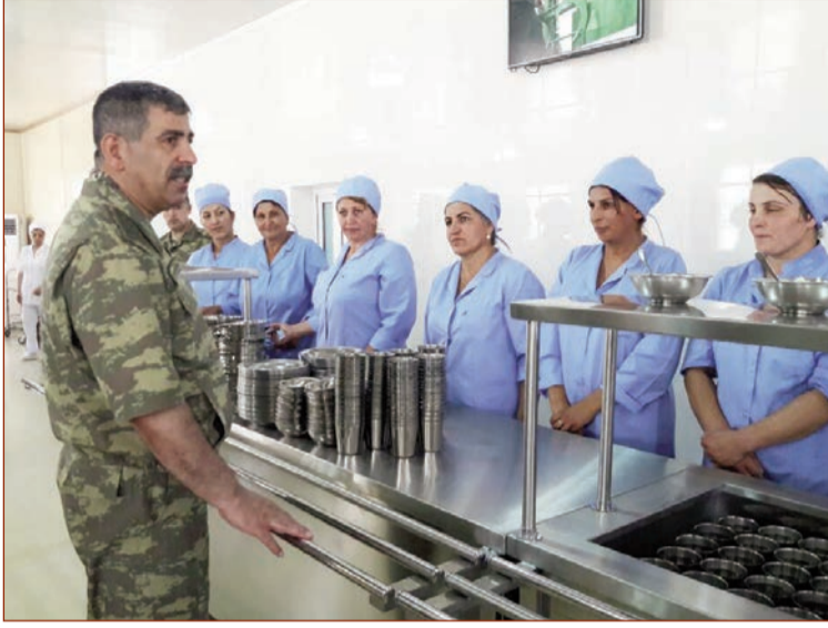
Azərbaycan Respublikasının Prezidenti, Silahlı Qüvvələrin Ali Baş Komandanı İlham Əliyevin göstərişinə əsasən, yeni tikilən növbəti hərbi hissənin açılışı olub.

Müdafiə Nazirliyinin rəhbərliyi cəbhə bölgəsində yeni inşa edilən hərbi şəhərciyin ərazisindəki qərargah, əsgər yataqxanaları, yeməxana, qazanxana-camaşırxana kompleksi, ərzaq anbarı, tibb məntəqəsi, sıra meydanı və digər obyektlər ilə tanış olub.