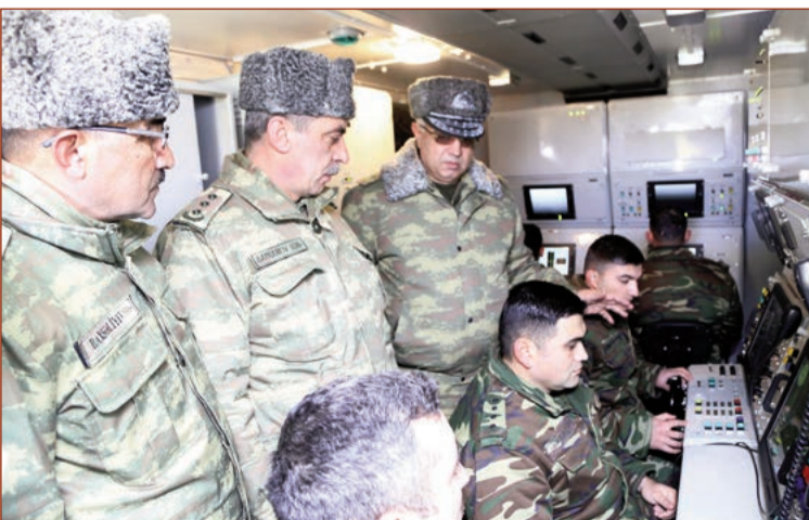
Azərbaycan Respublikasının Prezidenti, Silahlı Qüvvələrin Ali Baş Komandanı cənab İlham Əliyevin təsdiq etdiyi

Müdafiə Nazirliyinin 2016-cı il üçün döyüş hazırlığı planına əsasən, Hərbi Hava Qüvvələri və Hava Hücumundan Müdafiə Qoşunlarının döyüşə hazırlıq səviyyəsinin yoxlanılması davam edir.