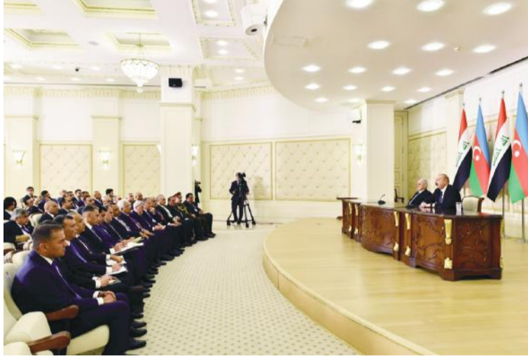
(Əvvəli 2-ci səhifədə)

Odur ki, Ermənistan öz gələcəyini regionumuzdan uzaqda yerləşən ölkələrin ambisiyaları üzərində deyil, öz milli maraqlarına əsasən planlaşdırmalıdır. Xüsusilə qanlı müstəmləkə keçmişinə malik olan ölkələrin ambisiyaları üzərində qurmamalıdır. Bunların müstəmləkə siyasəti əsasən dünyanın müxtəlif yerlərində müsəlman əhalisinə qarşı yönəlmişdir.