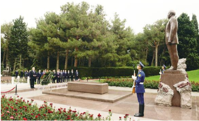
(Əvvəli 1-ci səhifədə)

Beləliklə, ilk növbədə, biz cənab Prezidenti Azərbaycana rəsmi səfərdə qəbul etməkdən çox şadıq. Bu, ikitərəfli əlaqələrimizin tarixində çox əlamətdar hadisədir. Bu, Azərbaycan müstəqil ölkə olandan bəri İraq Prezidentinin Azərbaycana ilk rəsmi səfəridir. Əminəm ki, səfər çox yaxşı nəticələr verəcək. Beləliklə, indi biz iqtisadi-ticari əməkdaşlıqla bağlı mühüm məsələlərin müzakirəsini davam etdirəcəyik. Əminəm ki, bu, həmçinin gələn ay Bağdadda keçiriləcək görüşün yaxşı nəticələrinə müsbət töhfə olacaq. Cənab Prezident, bir daha xoş gəlmisiniz.