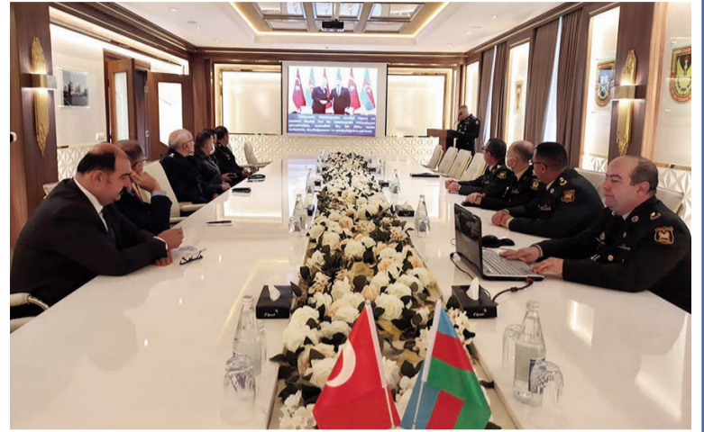
larına öz ürək sözlərini yazıb. Sonda qonaqlara komandanlıq adından hədiyyələr təqdim edilib.