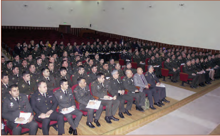
Müdafiə Nazirliyi Mətbuat Xidmətinin məlumatına əsasən, Müdafiə nazirinin 2019-cu il üçün təsdiq etdiyi döyüş

hazırlığı planına əsasən birlik, birləşmə, hərbi hissə və xüsusi təyinatlı hərbi təhsil müəssisələrinin kadr işləri üzrə heyətlərinin təlim-metodiki toplantısı keçirilib.