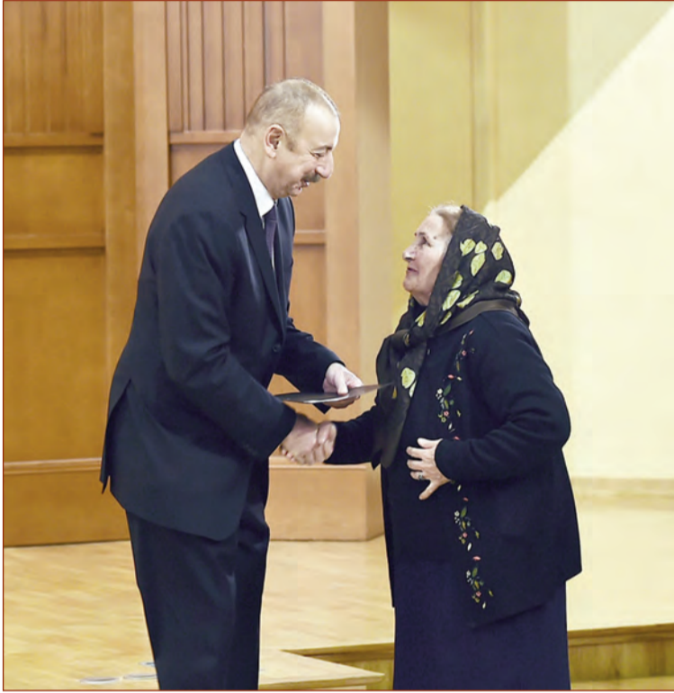
(Əvvəli 1-ci səhifədə)

Mənim fəaliyyətimdə bu məsələ daim prioritet təşkil edir. Son illər ərzində şəhid ailələri ilə çoxsaylı görüşlərim bunu bir daha sübut edir. Biz sizinlə birlikdə bir çox evlərin açılışlarında iştirak etmişik. Mən şəhid ailələrinə mənziillərin, avtomobillərin açarlarını şəxsən təqdim etmişəm və bunu özüm üçün borc bilərəm. Bu, mənim borcumdur, xalqa xidmət etmək mənim ən böyük vəzifəmdir. Mənim üçün bu, böyük şərəfdir ki, sizə bu istiqamətdə xidmətimi göstərim.