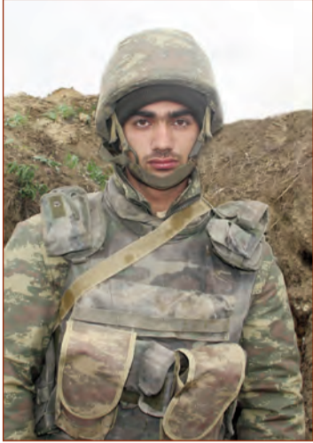
(Əvvəlki 4-cü səhifədə)