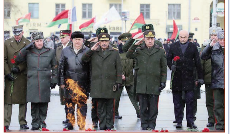
Minskə səfərdə olan Azərbaycan Respublikasının Müdafiə naziri general-polkovnik Zakir Həsənov Belarus Silahlı Qüvvələrinin yaradılmasının 100 illiyinə həsr olunan təntənəli mərasimdə iştirak edib.

Müdafiə Nazirliyi Mətbuat Xidmətinin məlumatına əsasən, iki ölkə arasında hərbi əməkdaşlığın inkişafında göstərdiyi xidmətlərə görə Azərbaycanın Müdafiə naziri "Belarus Respublikası Silahlı Qüvvələrinin 100 illiyi" yubiley medalı ilə təltif olunub.