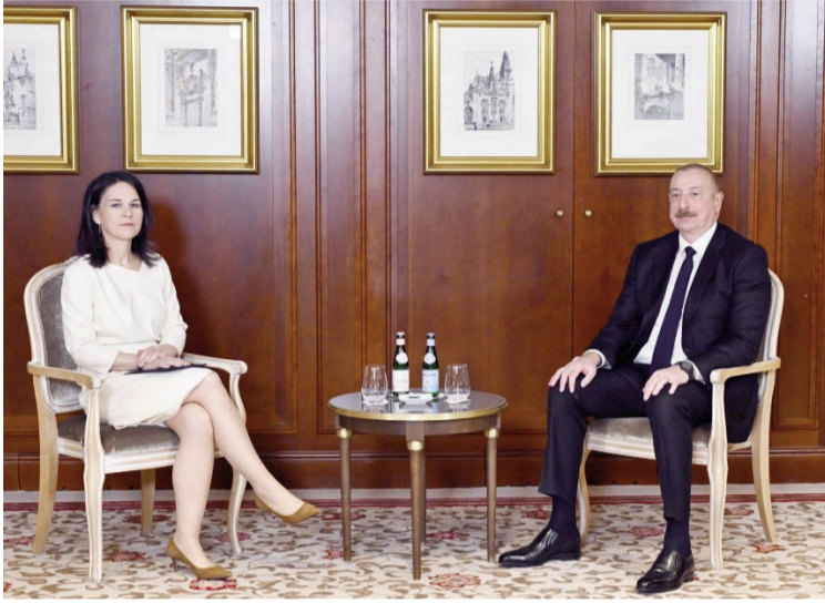
(Əvvəli 2-ci səhifədə)

Beləliklə, biz çox məsuliyyətə davrandıq və 80-dən artıq ölkəyə humanitar, maliyyə və texniki yardım göstərdik. Bir sözlə, ümid edirəm ki, həmin beynəlxalq platforma bizə Qlobal Cənub ölkələrini ümumi gündəliyə əlavə etmək imkanını yaradacaq. Eyni zamanda, bir çox Avropa ölkələri ilə münasibətlər uğurla inkişaf edir. Avropa İttifaqının doqquz üzvü ilə Azərbaycan "Strateji Tərəfdaşlıq" haqqında razılaşmalar və bəyannamələr imzalayıb, yaxud qəbul edib. Bunları söylədikdə, ümid edirəm ki, həmin beynəlxalq əlaqələr bizə həmrəyliyi gücləndirməyə imkan verəcək. Bizə məhz bu lazımdır. Bizə maliyyə lazımdır. Bizə həmrəylik lazımdır və bizə ortaq məsuliyyət lazımdır.