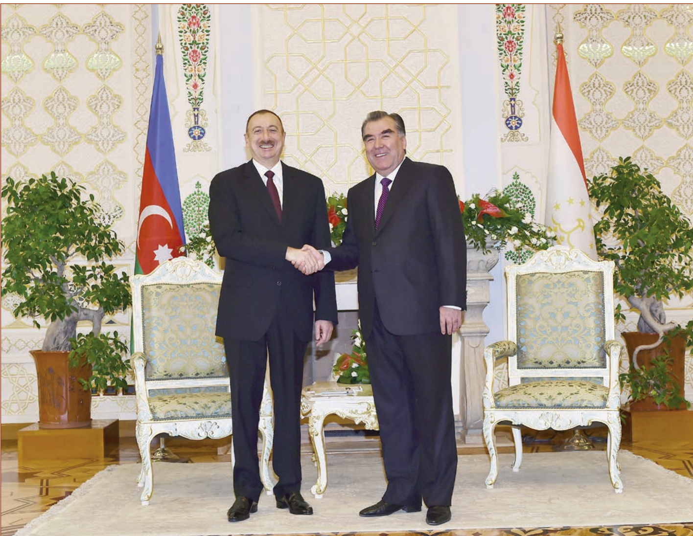
Hökumətlərarası Komissiyanın daimi Katibliyi Bakıda yerləşən TRASEKA layihəsi çərçivəsində Böyük İpek Yolunun bərpa olunmasında maraqlıyıq. Biz həm də Tacikistan ilə Azərbaycan arasında birbaşa aviareys açılmasında maraqlıyıq.

Vurğulandı ki, ölkələrimiz arasında qarşılıqlı ticarətin inkişafına əngəl törədən amillərdən biri neqliyyat-kommunikasiya imkanlarının məhdu olmasındadır. Ölkələrimizin coğrafi mövqeləri nəzərə alınmaqla, təbii ki, bu cür ticarət zəruri infrastruktur yaradılması tələb edir. Bu baxımdan biz