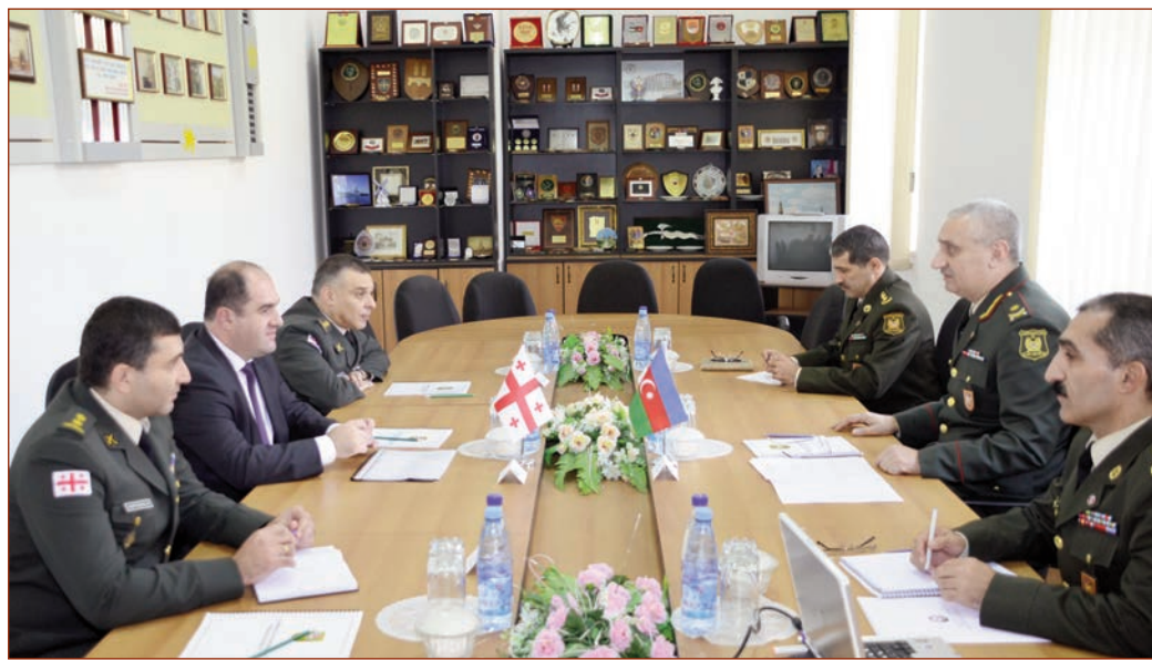
Bakı şəhərində Azərbaycan Respublikası Müdafiə Nazirliyi ilə Gürcüstan Müdafiə Nazirliyi arasında ikitərəfli hərbi əməkdaşlıq planının layihəsi razılaşdırılıb.

Danışıqlara Azərbaycan tərəfindən Müdafiə Nazirliyi Beynəlxalq Hərbi Əməkdaşlıq İdarəsinin rəisi