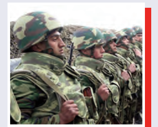
Dövlətin qayğısı, xalqın sevgisi