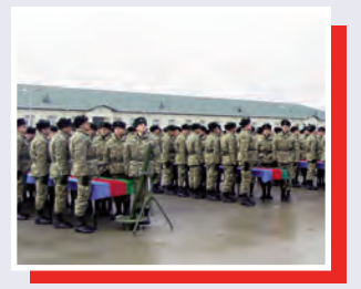
Silahlı Qüvvələrimizin hərbi hissələrində gənc əsgərlərin andiçmə mərasimi keçirilib