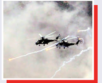
Vətənin hava müdafiəçiləri