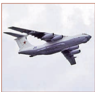
İl-76 hərbi-nəqliyyat təyyarəsi

İl-76 ağır hərbi-nəqliyyat təyyarəsidir. Rusiya mütəxəssislərinin bu layihəsi ilk dəfə Özbəkistanda Çkalov adına Daşkənd Aviasiya İstehsalat Birliyində buraxılıb, sonradan onun istehsalı Ulyanov aviastar müəssisəsində davam etdirilib. İlk dəfə İl-76 təyyarəsi 1971-ci ildə beynəlxalq ictimaiyyətə təqdim olunub. Sınaqlardan sonra HHQ-nin silahlanmasına qəbul edilmiş, "Şit-76" və