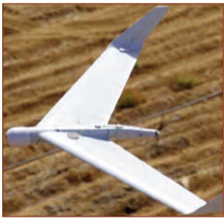
Orbiter pilotsuz uçuş aparatları