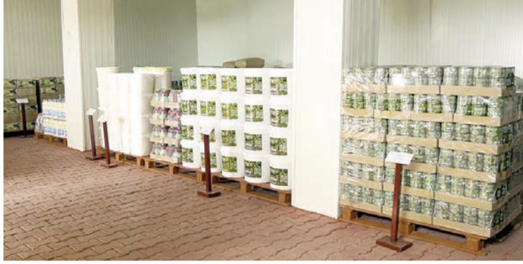
(Əvvəlki 3-cü səhifədə)