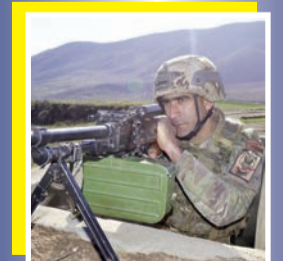
“Silahımı təmiz saxla...”

Sonda məzunlara sertifikatlar təqdim olunub.