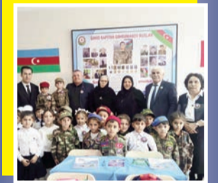
Şəmkirli igidin xatirəsi Nehrəm kəndində yad olundu