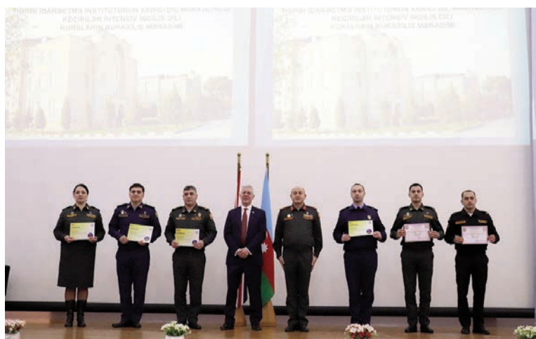
Müdafiə Nazirliyi xəbər verir ki, kursların başa çatması münasibətilə HİI-də buraxılış mərasimi keçirilib.

Milli Müdafiə Universitetinin (MMU) Hərbi İdarəetmə İnstitutunda (HİI) Xarici dil mərkəzinin, Böyük Britaniya və Şimali İrlandiya Birləşmiş Krallığının təşkilatçılığı ilə keçirilən intensiv ingilis dili kursları başa çatıb.