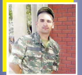
Qəhrəmanlıq sədaqətin tarixidi...