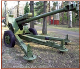
D-30A (2A18M) haubitsası

D-30A haubitsası düşmənin canlı qüvvəsini, atəş vasitələrini, səhra tipli tikililərini, minalanmış sahələrini və məftillənmiş maneələrini məhv etmək üçün təyin edilib. Onu avtomobilə daşımaq olar. Beton və asfalt örtüklü yollarda haubitsanın sürəti saatda 80 kilometr, daş döşənmiş yollarda isə saatda 35 kilometr təşkil edir. Bundan başqa haubitsa qar örtüyü olan ərazilərdən keçmək üçün xizək qurğusu ilə təchiz olunur.