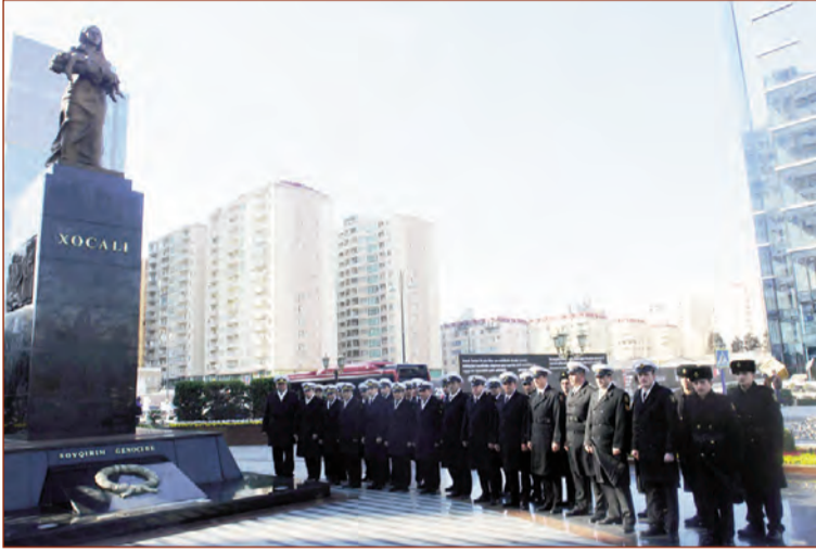
(Əvvəli 4-cü səhifədə)

Silahlı Qüvvələrdə Xocalı soyqırımının 25-ci ildönümü ilə əlaqədar tədbirlər keçirilib