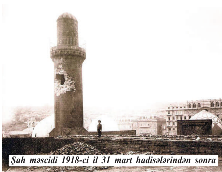
Şah məscidi 1918-ci il 31 mart hadisələrindən sonra