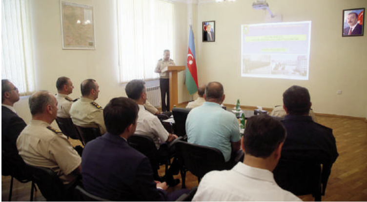
Müdafiə Nazirliyinin Milli Müdafiə Universitetinin tərkibində fəaliyyət göstərən Hərbi İdarəetmə Institutunun

Strateji araşdırmalar və dövlət müdafiəsinin idarəetmə akademik kursunun rəhbər heyəti ilə dinləyiciləri Heydər Əliyev adına Hərbi İnstitutu, eləcə də Cəmşid Naxçıvanski adına Hərbi Liseyi ziyarət ediblər.