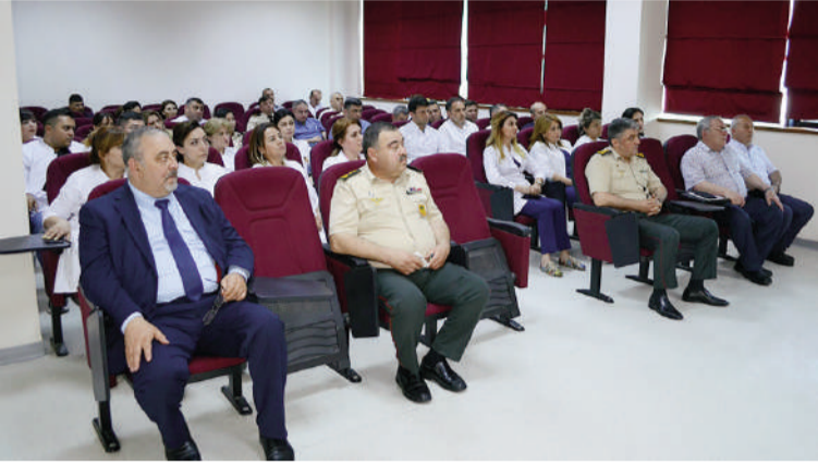
Müdafiə Nazirliyinin Baş Klinik Hospitalında Tibb İdarəsinin Tibbi Profilaktika və Ekologiya şöbəsinin təşkilatçılığı ilə "Silahlı Qüvvələrdə COVID-19 infeksiyasının dünnəni, bu günü və sabahı" mövzusunda terapevtik profilli elmi-praktik konfrans keçirilib.

Müdafiə Nazirliyi Mətbuat Xidməti xəbər verir ki, əvvəlcə ümummilli lider Heydər Əliyevin və Vətənimizin azadlığı uğrunda gedən döyüşlərdə canlarını fəda edən şəhidlərin xatirəsi bir dəqiqəlik sükutla yad edilib, Dövlət Himni səsləndirilib.