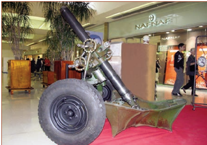
MQ-120-RT-61 minaatanı Fransanın "Brandt" şirkəti tərəfindən istehsal olunub və fransız ordusu-

nun silahlanması üçün MQ-120 AM-50 minaatanını əvəz etmək üçün hazırlanıb. Müxtəlif dünya ölkələrinə ixrac edilib. Lisenziya ilə AFR, İtaliya, Niderland, Braziliya, Türkiyə, ABŞ və bir çox orduların silahlanması üçün də istehsal olunub.