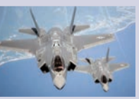
AZƏRTAC-ın materialları əsasında

Çexiya Hərbi Hava Qüvvələrində "F-35"lər İsveçdən icarəyə götürülmüş "JAS-39 Gripen" qırıcılarını əvəz etməlidir.