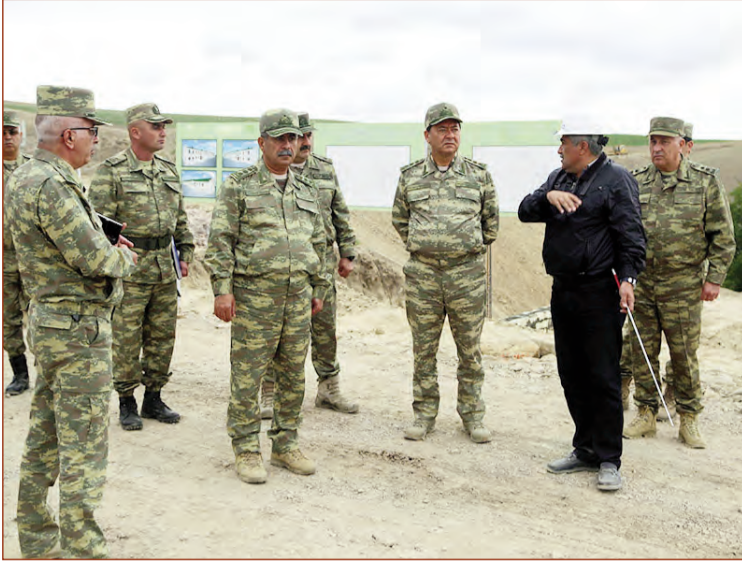
Azərbaycan Respublikasının Prezidenti, Silahlı Qüvvələrin Ali Baş Komandanı İlham Əliyevin göstərişinə əsasən, hərbi hissələrdə tikinti-quruculuq işləri davam etdirilir.