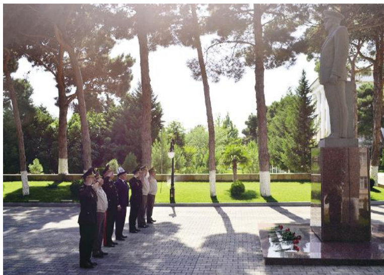
Qırğız Respublikasının müdafiə naziri general-leytenant Baktıbek Bekbolotovun rəhbərlik etdiyi nümayəndə heyətinin ölkəmizə səfəri davam edir.

Müdafiə Nazirliyi Mətbuat Xidməti xəbər verir ki, Qırğızıstanlı nümayəndələr Heydər Əliyev adına Hərbi İnstitutu ziyarət edib.