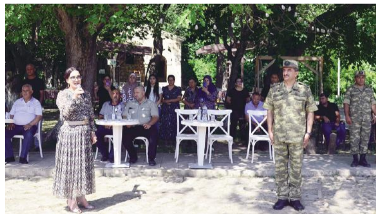
İyulun 9-da "N" hərbi hissəsinin yaradılmasının ildönümü münasibətilə tədbir keçirilib.

Müdafiə Nazirliyi Mətbuat Xidməti xəbər verir ki, tədbirdə Müdafiə Nazirliyinin və rayon İcra Hakimiyyətinin nümayəndələri, şəhid ailələri, qazilər, hərbi hissənin şəxsi heyəti, ictimaiyyət nümayəndələri və digər qonaqlar iştirak ediblər.