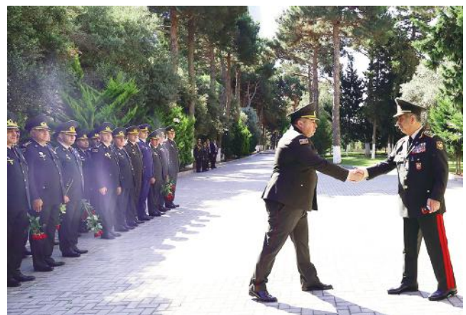
İyunun 26-da müdafiə naziri general-polkovnik Zakir Həsənov Azərbaycan Respublikası Prezidentinin Sərəncamına əsasən, ali hərbi rütbələr verilən Müdafiə Nazirliyinin hərbi qulluqçuları ilə görüşüb.

Müdafiə Nazirliyi Mətbuat Xidməti xəbər verir ki, Azərbaycan Respublikası Müdafiə Nazirliyinin hərbi qulluq-