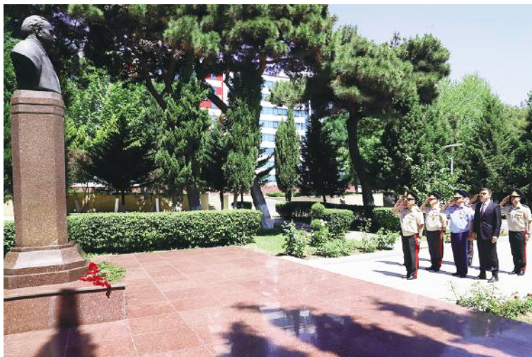
İyunun 26-da Müdafiə Nazirliyinin rəhbər heyəti Silahlı Qüvvələr Günü münasibətilə nazirliyin Baş Klinik Hospitalını ziyarət edib.

Müdafiə Nazirliyi Mətbuat Xidməti xəbər verir ki, əvvəlcə Azərbaycan xalqının Ümummilli Lider Heydər Əliyevin hospitalın heyətində ucaldılmış abidəsi önünə gül dəstəsi qoyulub. Ulu Öndərin və