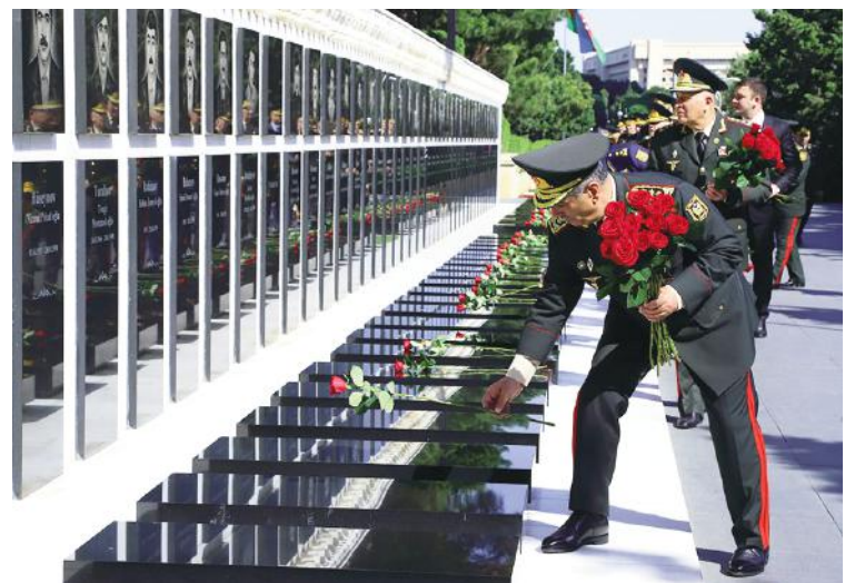
ni səsləndirilib. Bütün şəhidlərimizin ruhu dərin hörmət və ehtiramla anılıb.

Sonra Şəhidlər xiyabanına gələn nazirliyin rəhbər heyəti ölkəmizin müstəqilliyi, ərazi bütövlüyü uğrunda şəhid olmuş vətəndaşlarımızın məzarlarını ziyarət edərək "Əbədi məşəl" abidəsinin önünə əklil qoyub. Hərbi orkestrin ifasında Azərbaycan Respublikasının Dövlət Him-