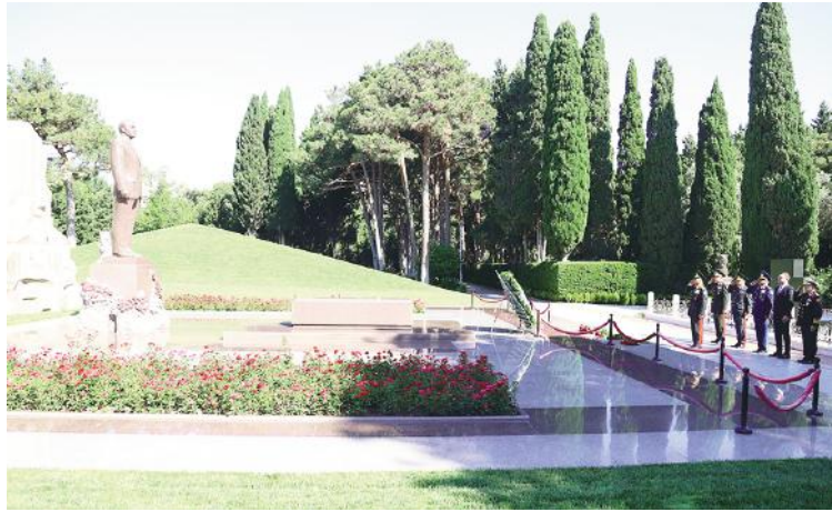
Silahlı Qüvvələr Günü münasibətilə iyunun 26-da Müdafiə Nazirliyinin rəhbər heyəti Fəxri xiyabanı və Şəhidlər xiyabanını ziyarət edib.

Müdafiə Nazirliyi Mətbuat Xidməti xəbər verir ki, əvvəlcə Azərbaycan xalqının Ümummilli Lideri Heydər Əliyevin abidəsi önünə gül dəstələri qoyulub, Ulu Öndərin xatirəsi hörmət və ehtiramla anılıb.