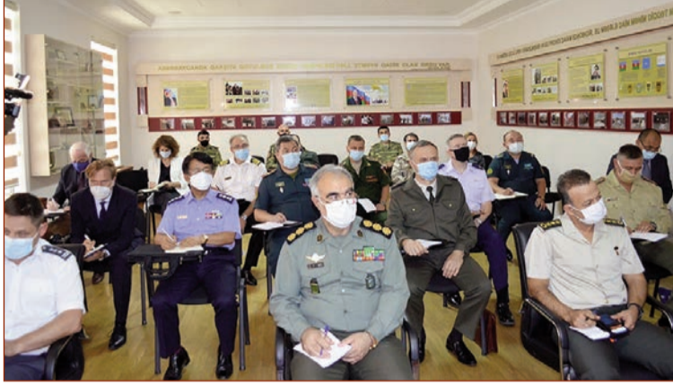
Müdafiə Nazirliyinin Beynəlxalq Hərbi Əməkdaşlıq İdarəsi tərəfindən oktyabrın 1-də Azərbaycan Respublikasında

akkredite olunmuş xarici hərbi ataşələr və beynəlxalq təşkilatların ölkəmizdəki nümayəndələri üçün Azərbaycanı qabaqalıcı tədbirlər görməyə vadar edən hadisələr haqqında brifinq verilmişdir. Əlavə olaraq, işğal olunmuş ərazilərdə həyata keçirilən əməliyyatların gedişatı, düşmən qüvvələrinə vurulmuş ziyan və digər məsələlər haqqında da qonaqlar məlumatlandırılmışdır.