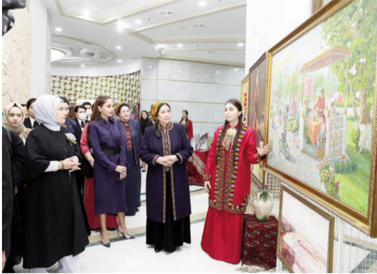
(Əvvəli 2-ci səhifədə)