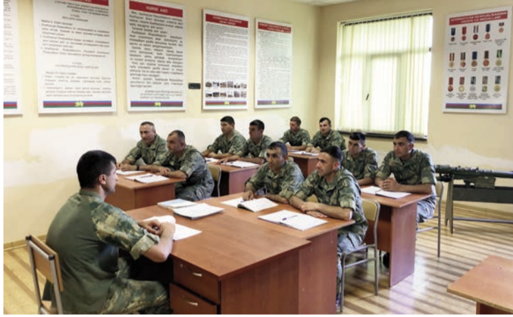
Təlim-toplantıya cəlb olunanlara taktiki, hərbi-tibb, mühəndis, topoqrafiya və

- Komandanlığın göstərişinə əsasən, daşınan zenit-raket kompleksinin manqa komandirləri ilə keçirilən toplantının təlim rəhbəriyəm. Məqsədimiz toplantıya cəlb olunmuş kiçik komandirlərin bilik və bacarıqlarını təkmilləşdirməkdir. Həmçinin manqa komandirlərinin döyüş fəaliyyətlərinə hazırlıq dövründə və onun gedişində taqımın silahlarla idarəetmə sistemlərinin təkmilləşdirilməsi, real döyüş tapşırıqlarının yerinə yetirilməsi zamanı bölmələrə praktiki rəhbərlik etmək bacarıqlarını artırmaqdır.