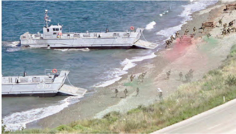
(Əvvəli 3-cü səhifədə)

Aprelin 27-dən mayın 2-nə qədər davam edən təlimdə pilotlar müxtəlif şəraitlərdə uçuş bacarıqlarını nümayiş etdirdilər. O cümlədən yeni texnika və silah sistemlərinin tətbiqi təlimin effektivliyini artıran əsas elementlərdən oldu. Təlim rəhbərləri iştirakçı heyətin fəaliyyətini yüksək qiymətləndirərək, bu tədbirin iki qardaş ölkənin hava məkanının təhlükəsizliyinin təmin olunmasında müstəsna əhəmiyyət kəsb etdiyini vurğuladılar.