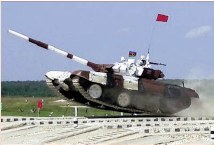
"Beynəlxalq Ordu Oyunları - 2016" yarışları çərçivəsində keçirilən "Tank biatlonu" müsabiqəsində iştirak edən Azərbaycan tankçıları

baycan tankçıları fərdi yarışlar zamanı müsabiqənin növbəti mərhələsində bütün hədəfləri məhv edərək Ermənistan komandasını qabaqlayıb və yarımfinala vəsiqə qazanıblar.