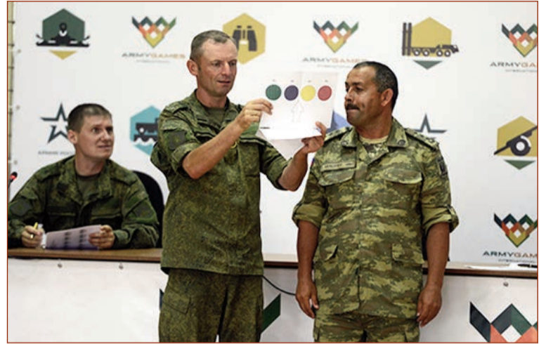
Avqustun 13-də yekun vurulacaq yarışların finalına 4 komanda çıxacaq.

Yarımfinal yarışları zamanı 4 komandadan ibarət qruplarda tankçılarımız avqustun 11-də Rusiya, Serbiya və Hindistan komandaları ilə gücünü sınayacaq.